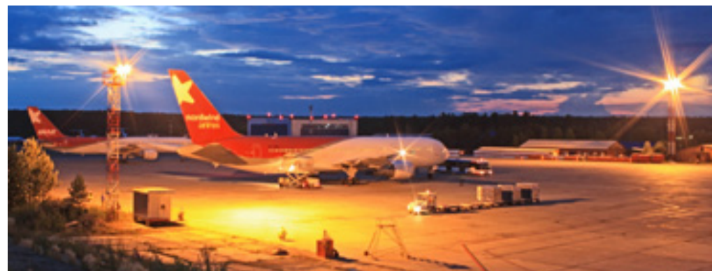
■ «Северный Ветер» готовится к вылету