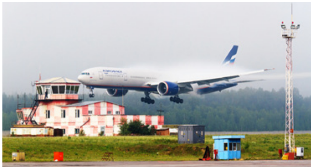
■ Туманным утром Боинг-777 эффектно заходит на посадку; фото — Сергей Гортман