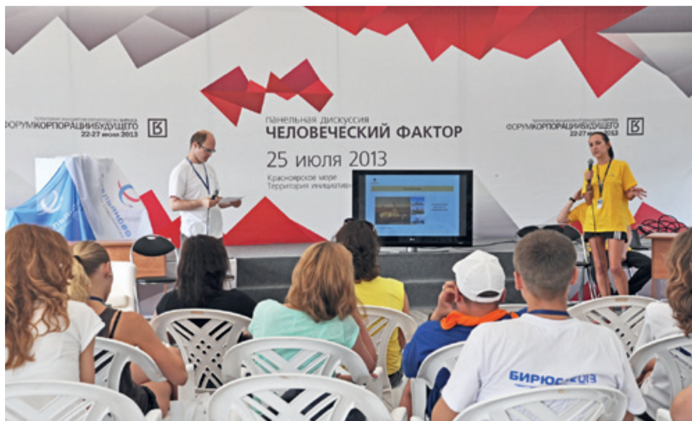
■ Тема панельной дискуссии, организованной командой аэропорта, оказалась всем близка: было заявлено 9 докладов