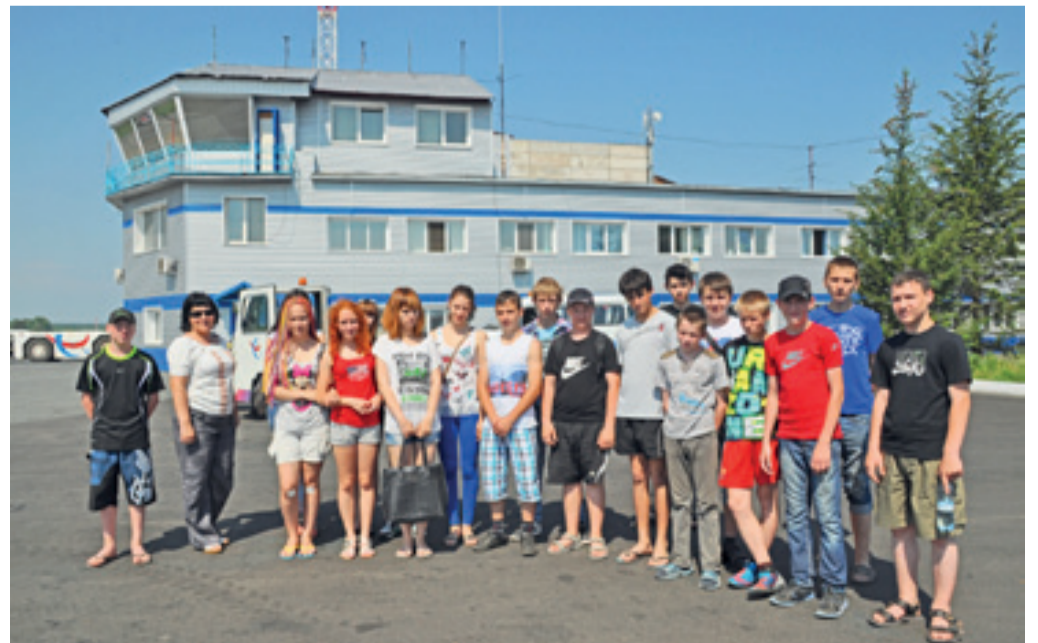
■ За проведенное в аэропорту время ребята получили много новой и полезной информации