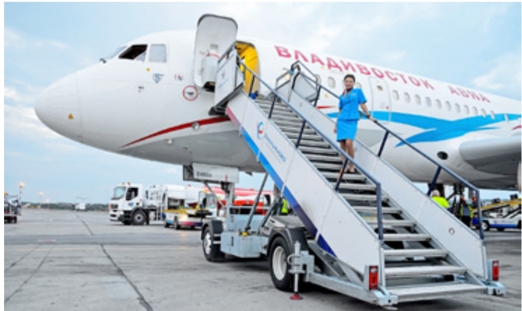
■ Гостеприимный экипаж а/к «ВладивостокАвиа»

■ Организатор споттинга — пресс-служба аэропорта «Емельяново» — выражает благодарность за содействие в проведении мероприятия службе спецтранспорта и службе авиационной безопасности аэропорта.