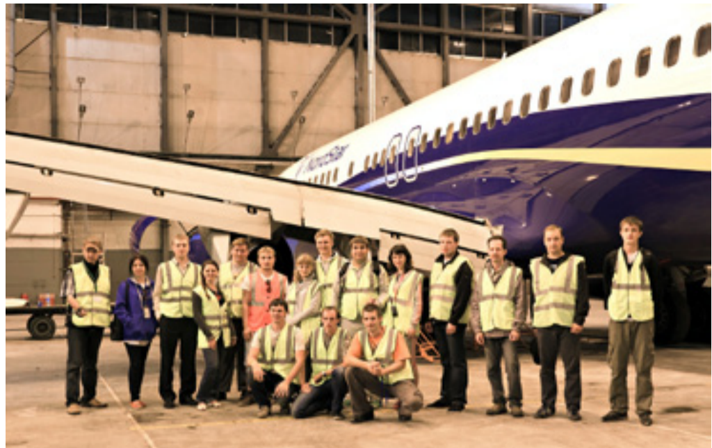
■ Ангар — отличное место для общего снимка, когда на улице уже ночь; фото — Сергей Гортман

своем живом журнале. Очень приятно, когда экипажи обращаются с просьбой поделиться фотографиями. В частности, командир экипажа авиакомпании «China Airlines» как-то написал мне, попросил выслать его фото, хотел вставить в рамочку, чтобы сыну подарить. Я, конечно, отправил ему, и он был очень благодарен».