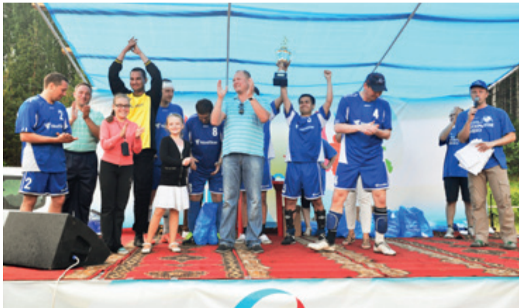
■ Победители турнира по мини-футболу — команда а/к «NordStar»

Аэропорт «Емельяново» намерен продолжать добрую традицию проведения спортивных семейных мероприятий для авиаторов. Уважаемые коллеги, у нас с вами есть время хорошенько подготовиться к следующим соревнованиям!