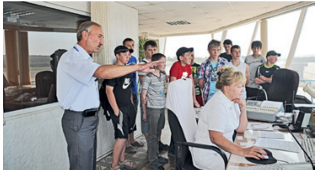
■ Рабочее место диспетчера: перрон как на ладони

За проведенное в аэропорту время школьники получили много новой, интересной и полезной информации, в том числе о правилах пассажирских перевозок и авиационной безопасности. Гости остались довольны — знакомство с работой служб аэропорта оставило, по их словам, самые яркие впечатления. Ребята выразили большую благодарность руководству и сотрудникам аэропорта за организацию и проведение экскурсии на высочайшем уровне.