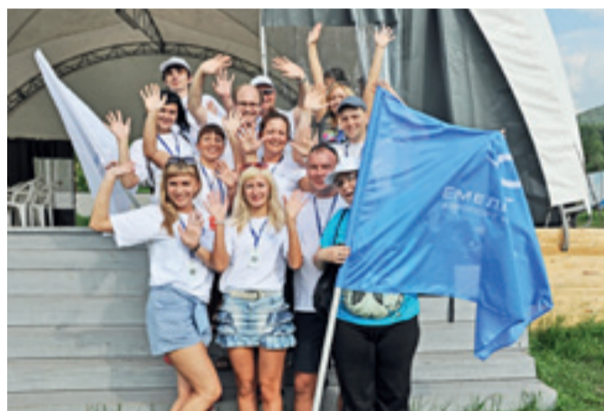
■ Сборная команда «На взлете!»

Всего участниками этой смены стали 23 команды, которые представляли различные крупные компании Красноярского края и Красноярска, в том числе Роснефть (Ванкорнефть и Ачинский НПЗ), Сбербанк, РЖД, СУЭК, КрасКом, СИБУР, Газпромбанк, СМ.Сити и многие другие предприятия.