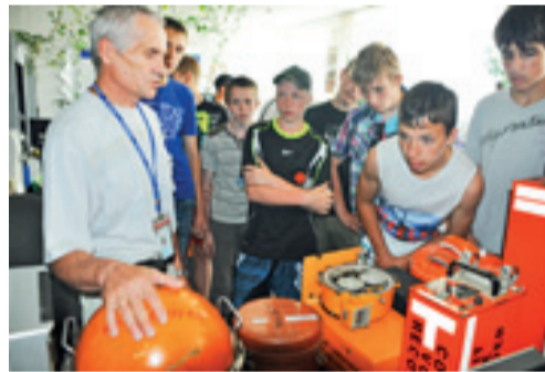
■ Ребята с удивлением узнали как на самом деле выглядят «черные ящики»

После краткой обзорной экскурсии школьники отправились в производственно-диспетчерскую службу. Постояв рядом с