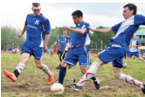
(фотоотчет о празднике — на официальном сайте аэропорта «Емельяново» www.yemelyanovo.ru в разделе «Фотогалерея»)