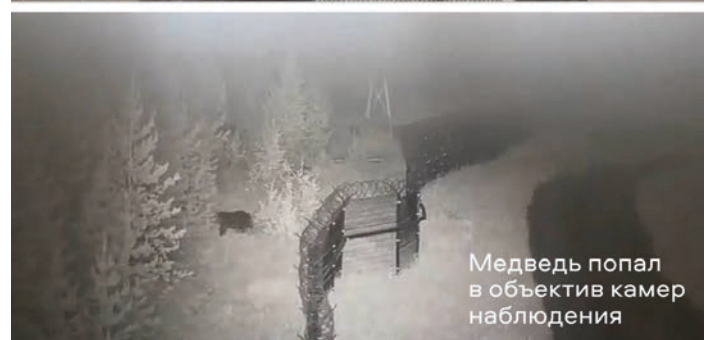
Медведь попал в объектив камер наблюдения