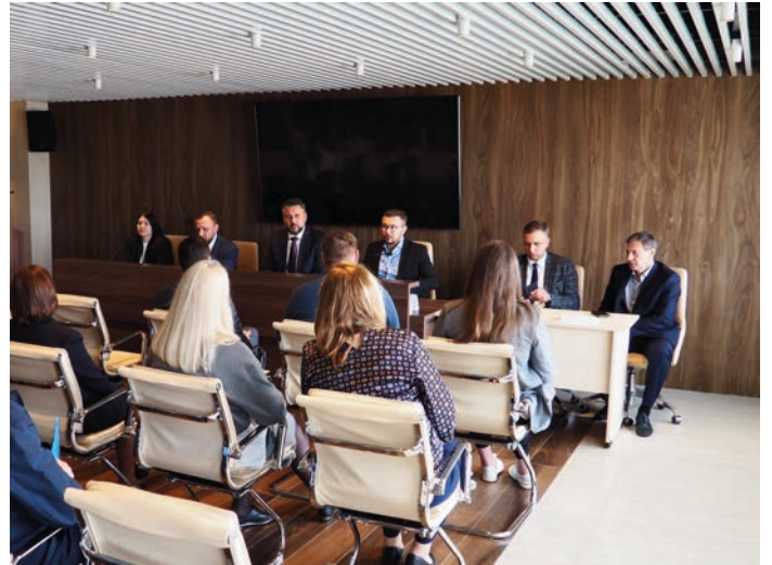
ГРАФИК ПРИЕМА СОТРУДНИКОВ